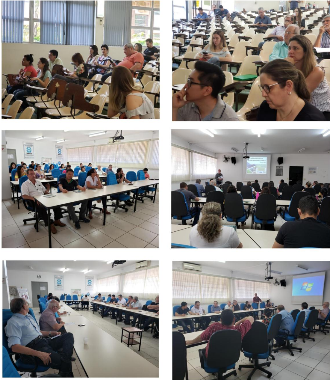
Figura 4.2 Reuniões de pactuação das ações para atualização e revisão do PA/PI 2020/2023

A seguir, o fluxograma demonstrando as etapas para pactuar as ações na UGRHI-22.