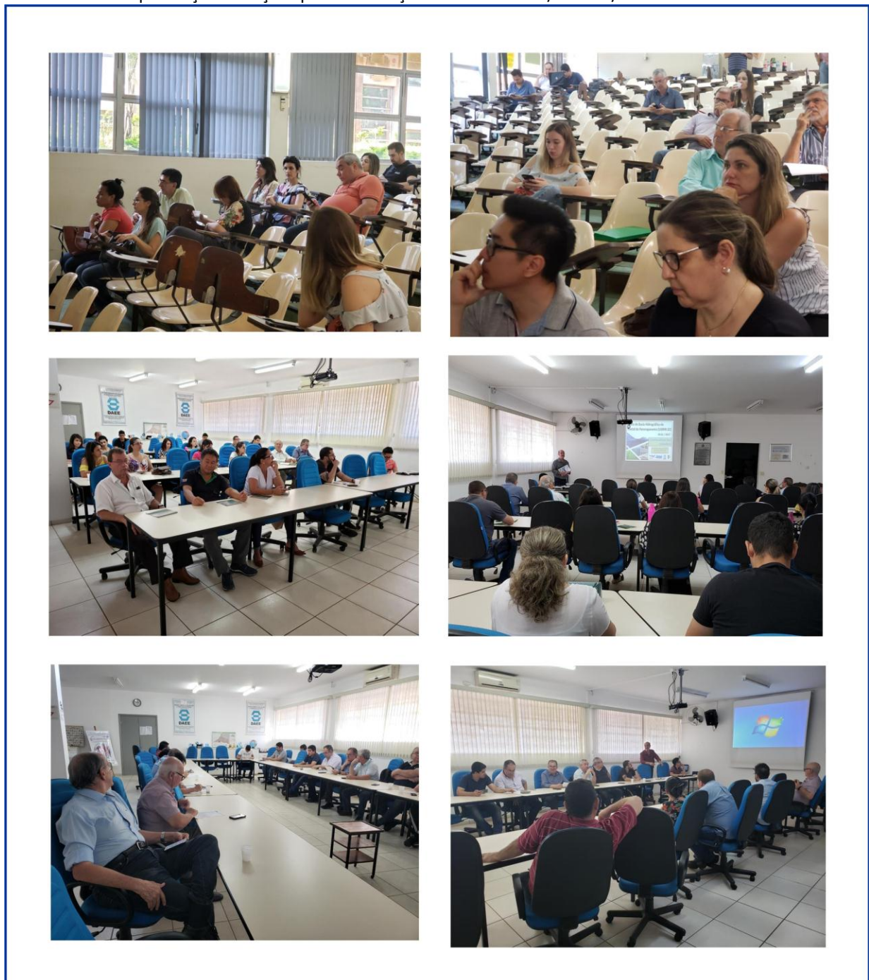
Figura 4.2 Reuniões de pactuação das ações para atualização e revisão do PA/PI 2020/2023

Considerando o processo de revisão e atualização, o processo de pactuação vem sendo desenvolvido e aprimorado a cada ano. Este ano de 2019, com a revisão e atualização o processo de pactuação pode ser conferido abaixo: